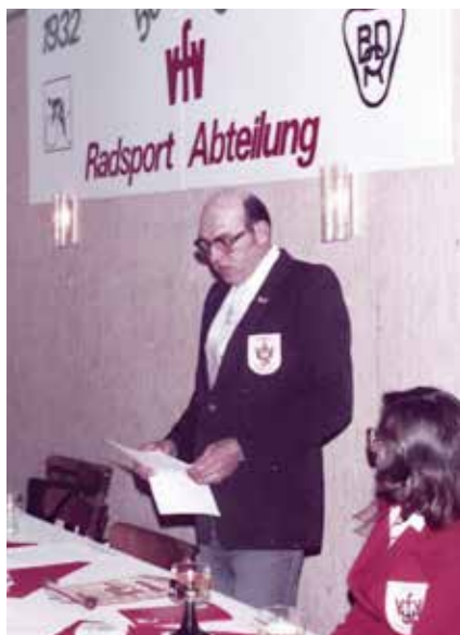
Vorsitzender beim Jubiläums-Kommers