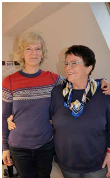
Harmonie machte den Wechsel etwas leichter