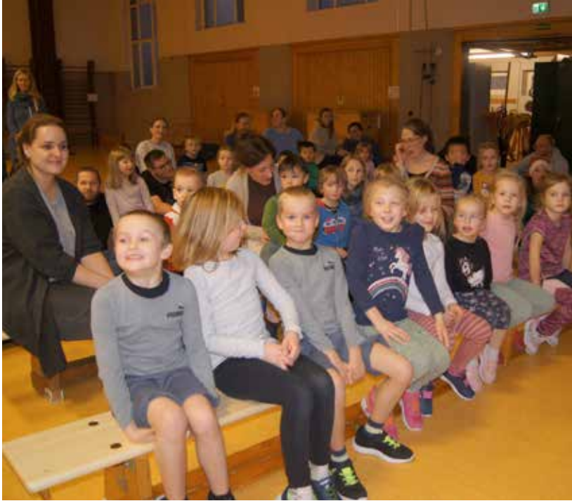
Es gibt gemütliche Plätze im Parcours