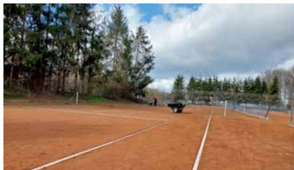
Die Anlage vor dem Saisonstart

Langsam nähert sich der Frühling, ab und zu soll die Sonne sogar schon einmal gesichtet worden sein! Also kann es eigentlich nicht mehr lange dauern, bis wir endlich wieder mit unserem Sport starten dürfen. Ja, unser Sport kann auch in der Halle betrieben werden, aber da kostet jede Stunde viele Euros extra. Außerdem ist ja Hallen-Tennis, mit Freiluft-Tennis nur eingeschränkt vergleichbar. Die Platzfehler, die Sonne und der Wind fehlen einfach als Entschuldigung für schlecht geschlagene Bälle.