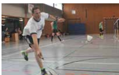
Oliver mit vollem Einsatz