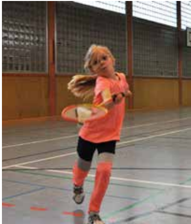
Auch Tori trainiert mit Freude