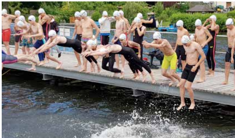
Auf geht's zum Start

An dem Wochenende 01/02.07.2023 fanden in Mölln die Norddeutschen- und Landes Freiwassermeisterschaften statt. Dazu machten sich 20 Aktive und zahlreiche Betreuer*innen und Eltern, zum Teil bereits Freitag, auf den