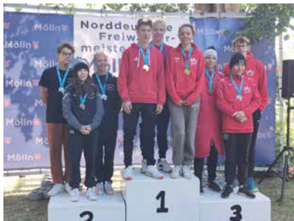
Siegerehrung der Staffeln