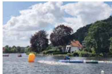
Platzkampf nach dem Startschuss

Am Samstag standen die 5km auf der Tagesordnung. Dieser Strecke