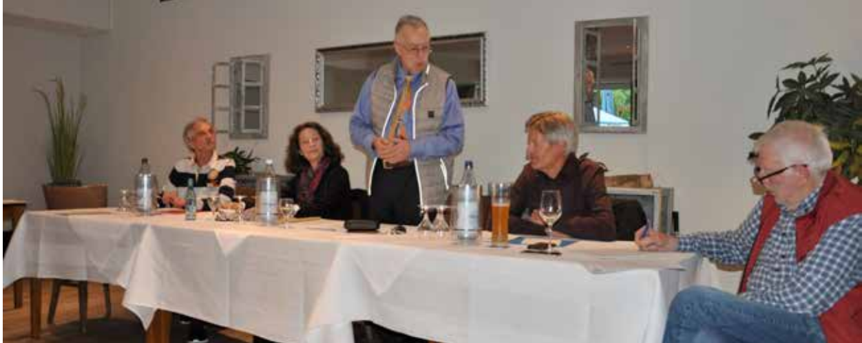
Die letzte Sitzungseröffnung