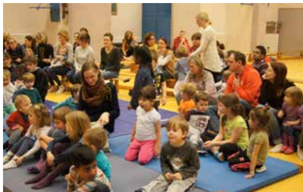
Letztes Weihnachtsturnen mit zahlreichen Kindern und Eltern

Der Weihnachtsmann kommt am Freitag, dem 15. Dezember 23, um 15.30 Uhr zu den Vorschulkindern in die Elisabeth-Schule in der Moltkestraße. Zu Beginn steht ein Parcours zum Mitmachen bereit.