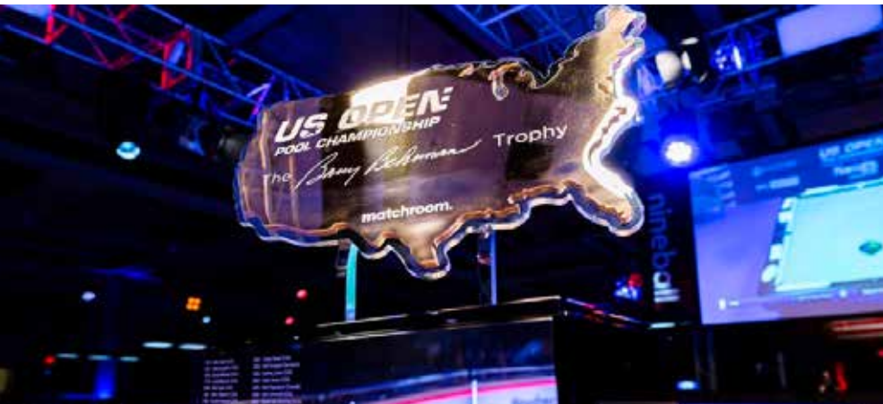
Spielstätte in Atlantic City