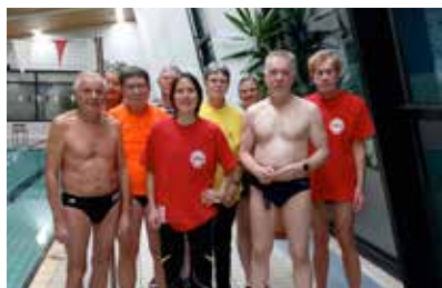
Die bunt gemischte Mastersschwimmgruppe

Unsere Mastersgruppe ist eine bunte Mischung aus Schwimmerinnen und Schwimmern verschiedenster Altersklassen, die mit viel Spaß und Freude den Schwimmsport ausüben. Während unserer Trainingszeiten kann jede und jeder nach seinem Tempo trainieren, sich gesund und fit halten oder unter Anleitung ein paar Tricks und Kniffe