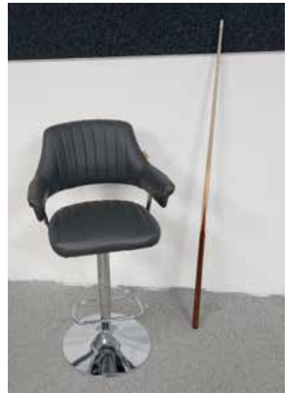
Neuer höhenverstellbarer Stuhl

Am 08.12. ist eine Weihnachtsfeier für die Mitglieder der Abteilung geplant, zu der gern auch Angehörige und Freunde mitgebracht werden dürfen. Desweiteren findet am 13. Januar in unserem Vereinsheim ein Neujahrsturnier statt. Alle Mitglieder sind eingeladen, an dem Multiballturnier teilzunehmen. Es wird mit Handicap gespielt – d. h., schwächere Spieler erhalten vorab Spiele gutgeschrieben – um