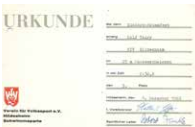
Erste Urkunde von 1963