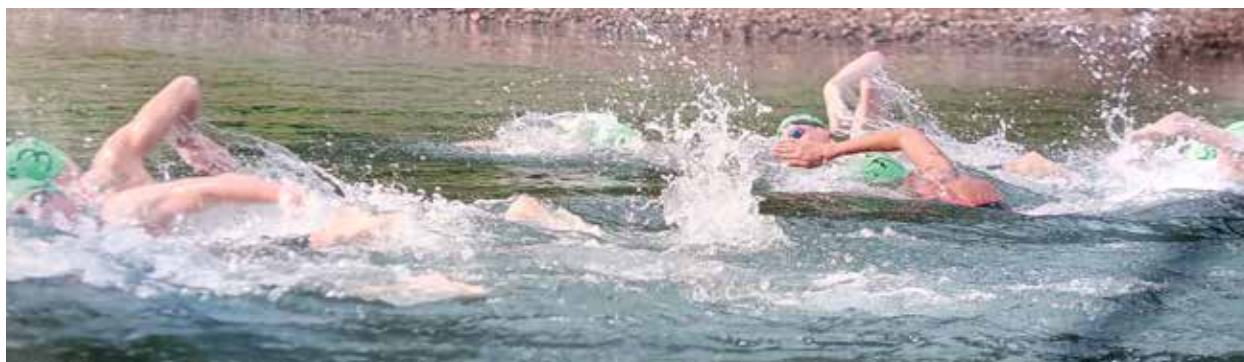
Wettkampf in der Aggetalsperre