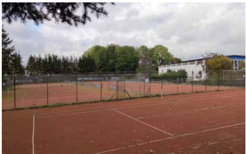
Tennisanlage im Herbst 2023