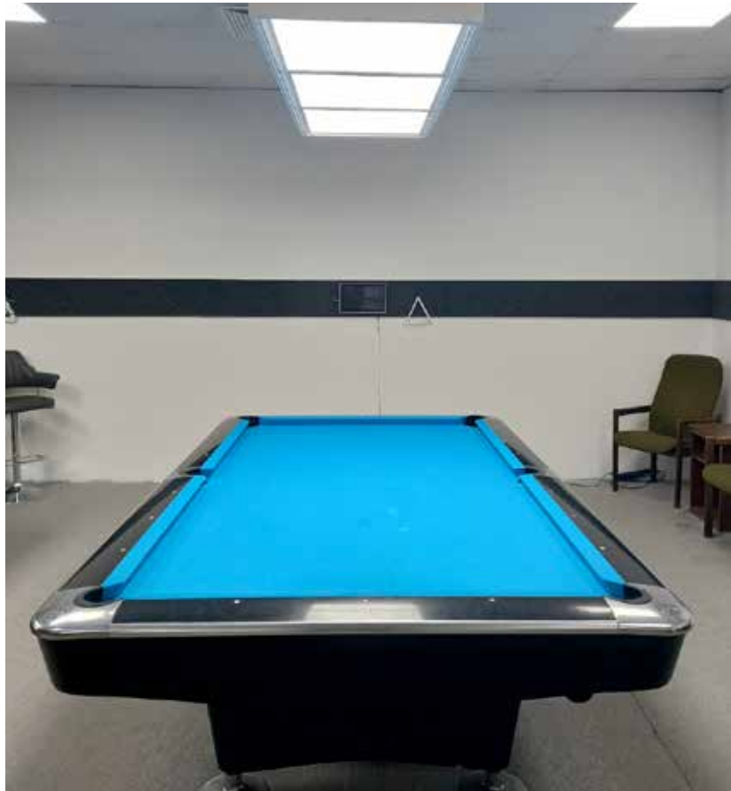
Tisch mit neuer Beleuchtung

Auch die höhenverstellbaren Sitzgelegenheiten wurden angeschafft und werden gerne genutzt. Mit dem Anbringen von