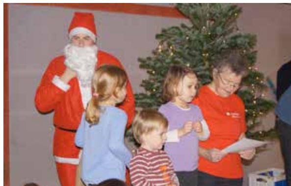
Der Weihnachtsmann war endlich da