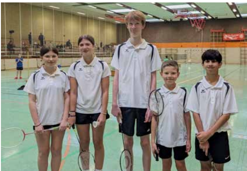
Unsere Teilnehmer beim Saisonauftakt